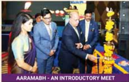
AARAMABH - AN INTRODUCTORY MEET