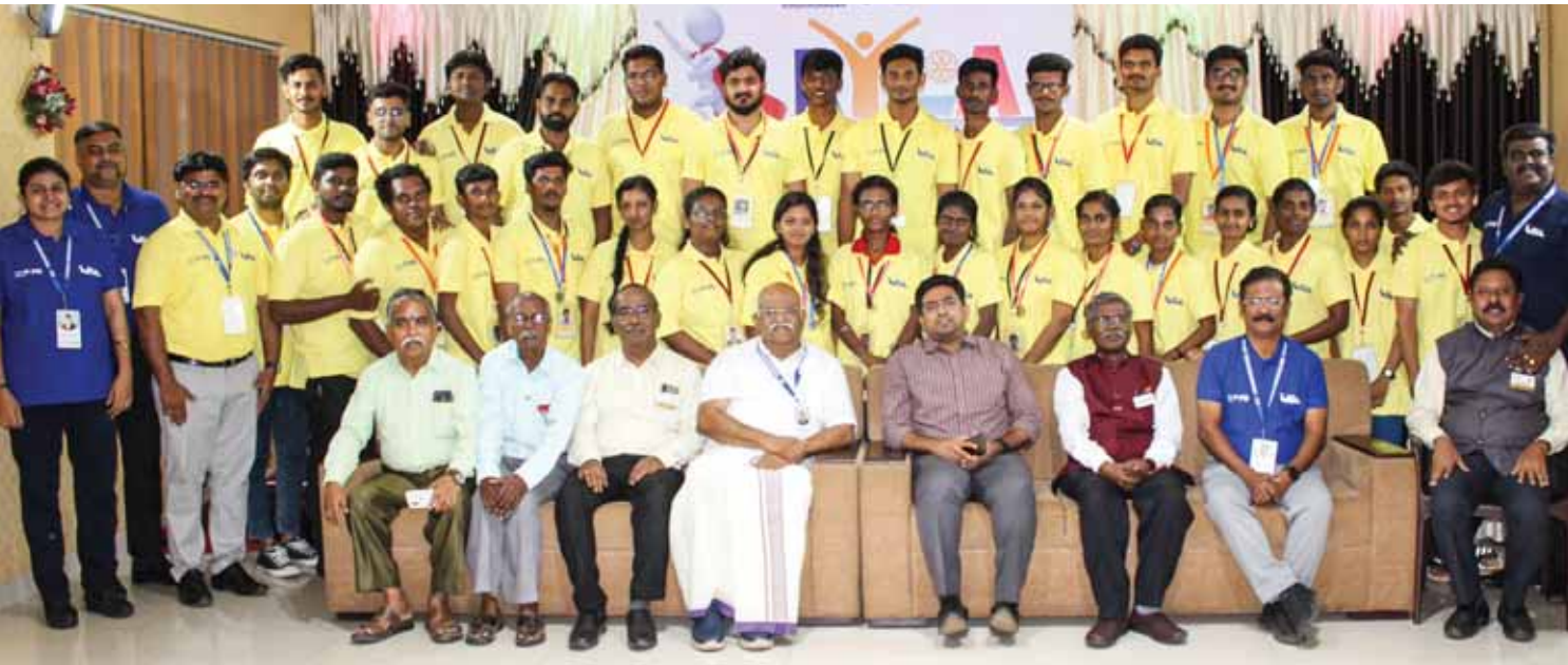
DG முத்து மற்றும் திருநெல்வேலி மாவட்ட ஆட்சியர் விஷ்ணு வேணுகோபாலன் RYLA பங்கேற்பாளர்களுடன்.

பஞ்ச குருகுலம் (PG) என்ற பயிற்சி அமைப்பின் மூலம் நடத்தப்படுகிற இந்தத் திட்டத்தில் ஒவ்வொரு பங்கேற்பாளருக்கும் பயிற்சி அளிக்கும் உண்மைச் செலவு ரூ.11,500. ஆனால், RYLAல் இந்தப் பயிற்சி ரூ.2,500 மானியக் கட்டணத்தில் வழங்கப்படுகிறது.