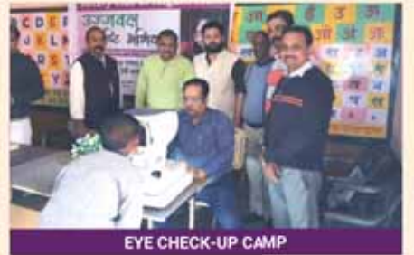
EYE CHECK-UP CAMP