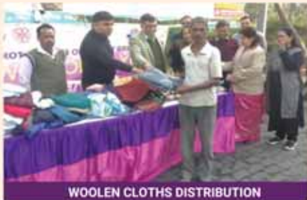
WOOLEN CLOTHS DISTRIBUTION