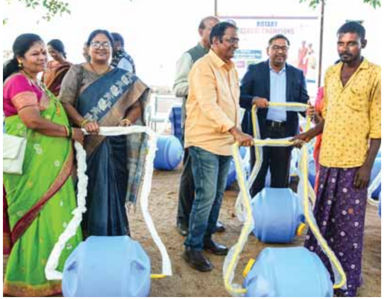
DG ராஜசேகர் ரெட்டி (இடமிருந்து 4வது) நீர் சக்கரங்கள் வழங்கும் விழாவில்.

ஹைதராபாதிலிருந்து 150 கி.மீ. தொலைவில் உள்ள நல்கொண்டா மாவட்டத்தில் உள்ள கம்பலபள்ளி கிராமத்தின் குடிநீர் தேவையை பூர்த்தி செய்யும் ஒரு முன்னோடி திட்டத்தை தொடங்கினோம். அடுத்து ஹைதராபாதிலிருந்து 370 கி.மீ. தொலைவில் அதிலாபாதிஸ் உள்ள கிராமங்களுக்கு இத்திட்டம் விரிவுபடுத்தப்பட்டது. கடந்த நவம்பரில் நல்கொண்டாவில் 42 நீர் சக்கரங்கள் வழங்கப்பட்டன. பின்னர் டிசம்பர் 24ம் தேதி அதிலாபாதிஸ் உள்ள இரு கிராமங்களுக்கு 137 நீர்ச் சக்கரங்கள் வழங்கப்பட்டன.