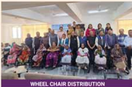
WHEEL CHAIR DISTRIBUTION