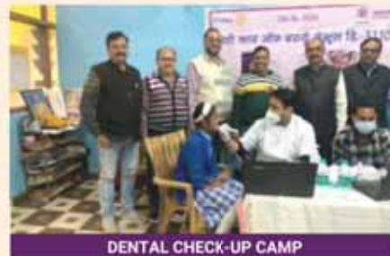
DENTAL CHECK-UP CAMP