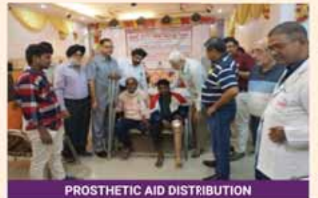
PROSTHETIC AID DISTRIBUTION