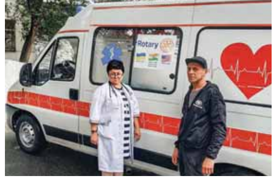
உக்கரைன் மருத்துவமனையிற்கு அளிக்கப்பட்ட ஒரு ஆம்புலன்ஸ்.

போரினால் பாதிக்கப்பட்ட நாட்டில் அவசரகால சுகாதாரப் போக்குவரத்தை வழங்க இப்போது ஆம்புலன்ஸ்கள் பயன்