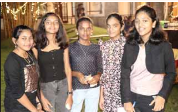
குலுக்கல் சீட்டு விற்பனை உக்ரைனுக்காக உதவும் RC மதுரை மெட்ரோ ஹெரிட்டேஜ் ஆனெட்கள்.

RC மதுரை மெட்ரோ ஹெரிட்டேஜ், RID 3000ன் ஆனெட்கள் சங்கம் ஒரு நிகழ்ச்சியின் போது உறுப்பினர்களுக்குப் பரிசுக் குலுக்கல் சீட்டுகளை விற்று, உக்ரைனுக்கு உதவுவதற்கு ரூ.25,500 (300) திரட்டியது. இந்த நிதி RC ட்னிப்ரோ, RID 2232, உக்ரைனுக்கு அனுப்பப்படும். ■