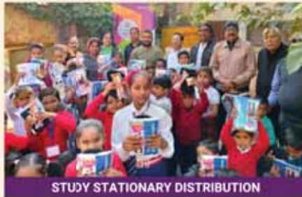
STUDY STATIONARY DISTRIBUTION