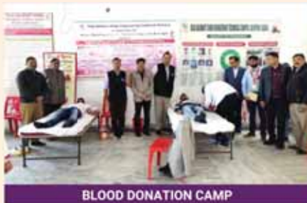
BLOOD DONATION CAMP