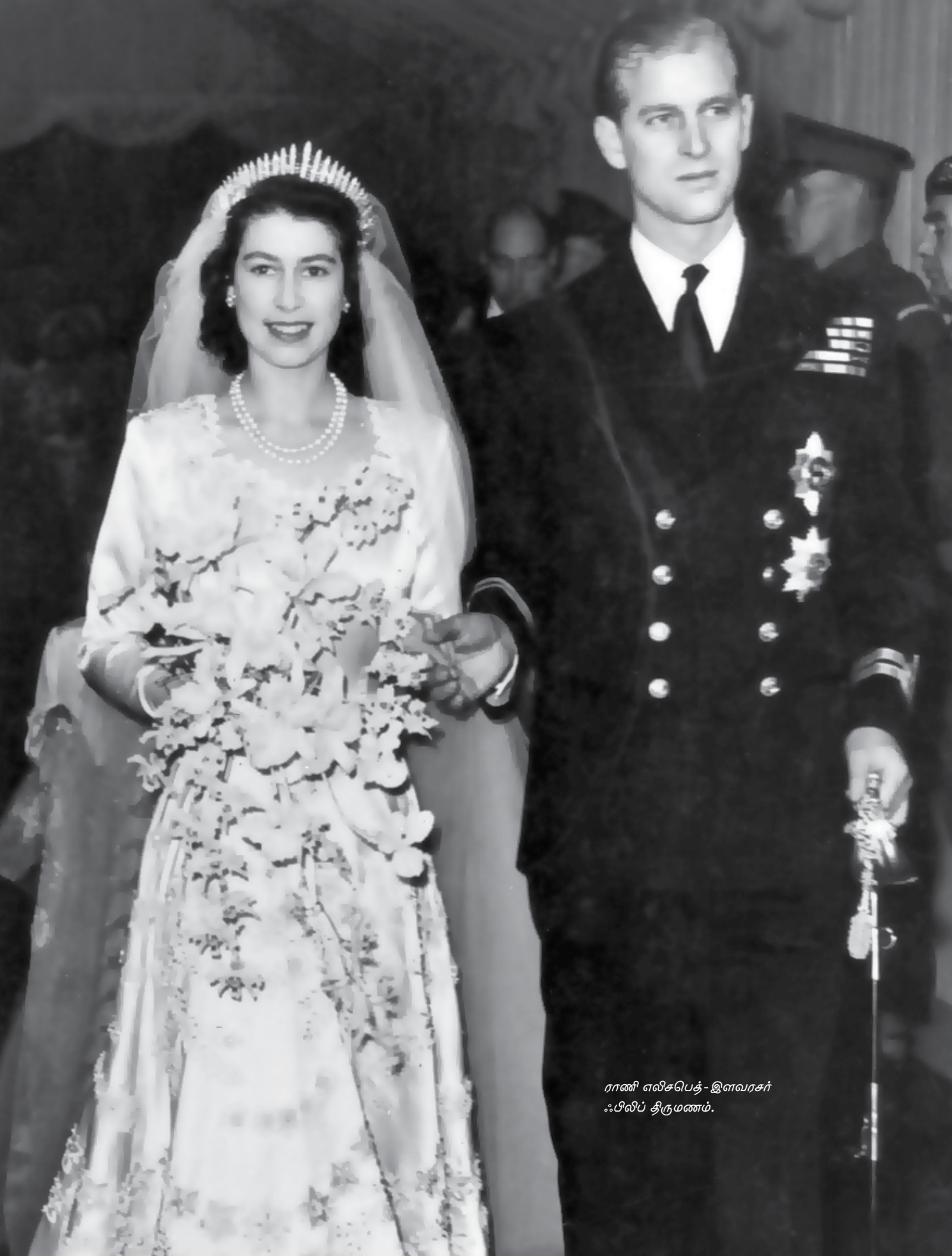
ராணி எலிசபெத் - இளவரசர் ஃரிலிப் திருமணம்.