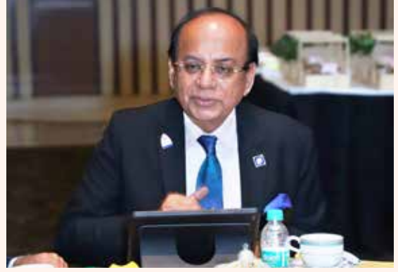
DG அஷோக் கன்ட்ரீர்

சுற்றுப்புற சூழல் பாதுகாப்பு கருதி RID 3011 DG அஷோக் கன்ட்ரீர் தன் மாவட்டத்தில் ஆவணங்கள், கடிதங்கள் அனைத்தையும் காகிதமில்லாமல் மின்னஞ்சல் கணினி மூலம் செய்தி பரிமாற்றம் செய்யக் கோரியுள்ளார். ■