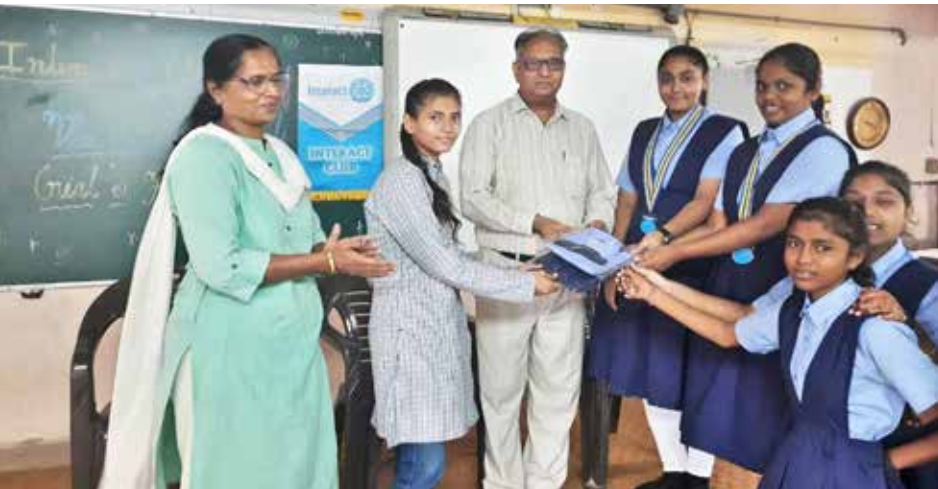
குஷி திட்டத்தின் கீழ் ஒரு பெண்ணிற்கு சிருடை (வீஷ்வபாரதி பெண்கள் பள்ளியின் இன்டராக்ட் மூலம்) வழங்கப்படுகிறது.

உக்ரைனில் உள்ள குழந்தைகளின் அவநிலை பற்றி விஸ்வ பாரதி