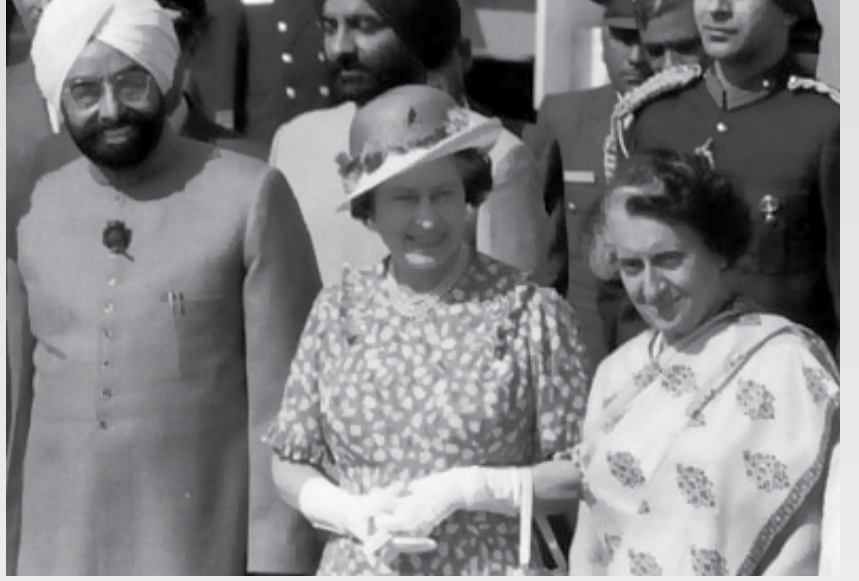
பிரதம மந்திரி இந்திரா காந்தி மற்றும் குடியரசு தலைவர் ஜெயில் சிங் அவர்களுடன்.

இதுபோன்ற சுவாரஸ்யமான வரலாற்று கண்ணோட்டங்கள், ராணி