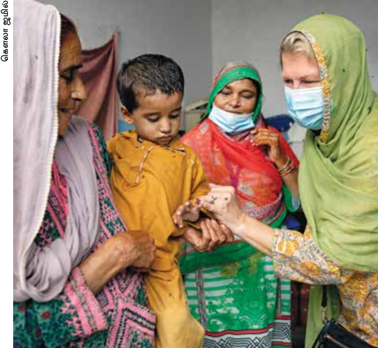
கராச்சியில் (பாகிஸ்தான்) போலியோ தடுப்பு மருந்து அளித்தப்பின் ஒரு குழந்தையுடன் RI தலைவர் ஜெனிஃபர் ஜோன்ஸ்.