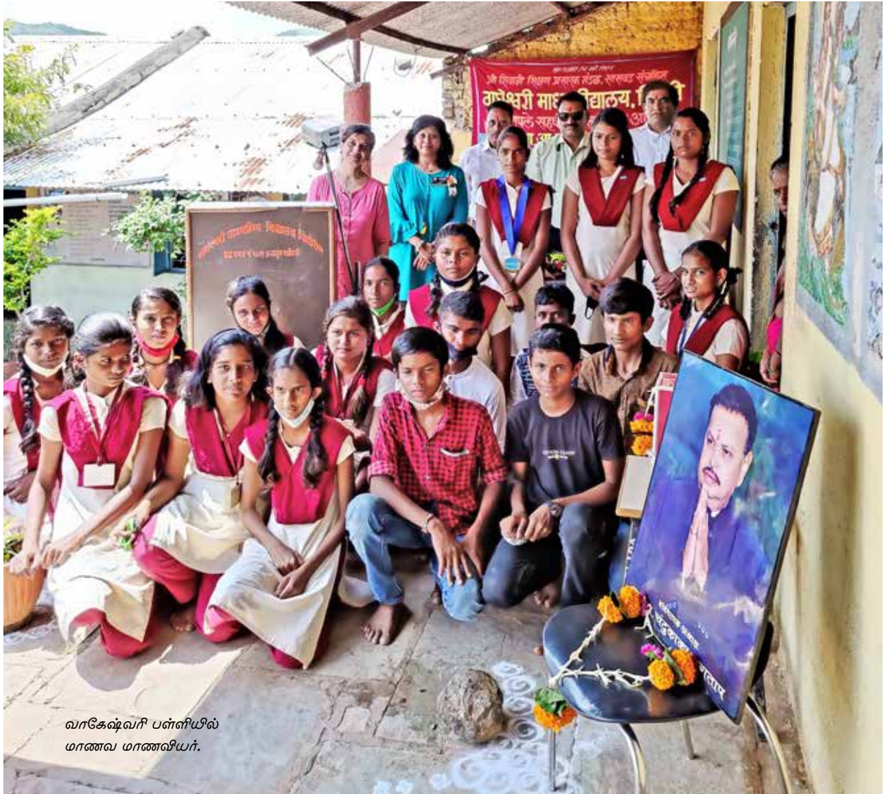
வாகேஷ்வரி பள்ளியில் மாணவ மாணவியர்.

ஏற்படுத்தினர். அதன் மூலம் விவசாயிகள் ஆர்டர்களைப் பெற்று அவற்றை வாடிக்கையாளர்களுக்கு அனுப்பிவைத்தனர். வாரம் இரு முறை அவை இளைஞர்கள் மூலம் விநியோகிக்கப்பட்டு வந்தன. பழங்கள், காய்கறிகள் தரமானதாகவும், புத்தம் புதியதாகவும் கிடைப்பதால் ரோட்டேரியன்கள் அல்லாத மக்களும் அவற்றை வாங்க முன்வந்தனர். இதனை அடுத்து கிராமத்து இளைஞர்கள் ஒரு டெம்போவில் தங்கள் விளைப் பொருள்களை கொண்டுவந்து அவுர்தில், ஆகாஷ்கங்கா சொசைட்டி பருதியில் விற்பனை செய்யத் தொடங்கினர். இதன் மூலம் விற்பனையும்