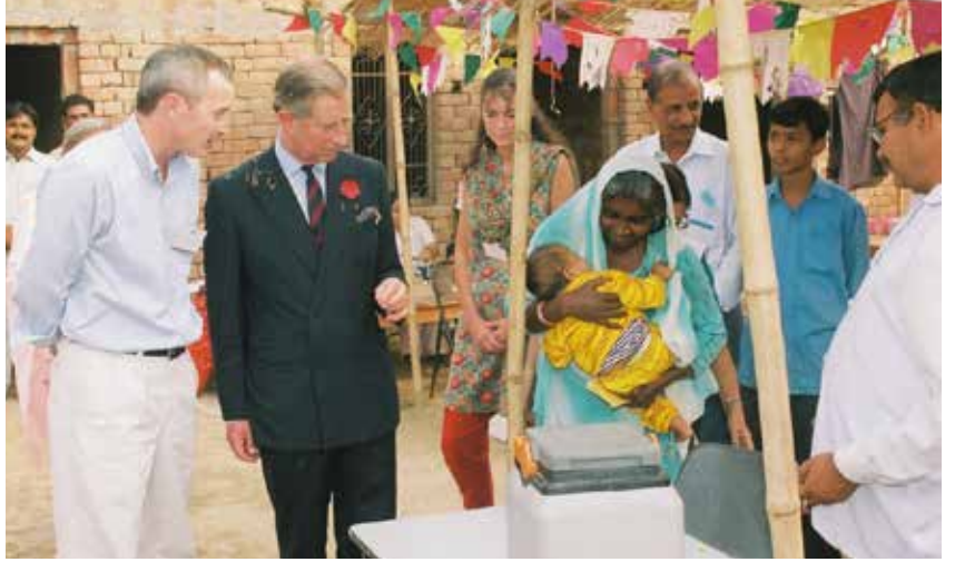
2003ம் ஆண்டு தில்லியில் நடைபெற்ற ஒரு போலியோ NIDயில் பிரிட்டிஷ் அரசர் சார்லஸ் III.