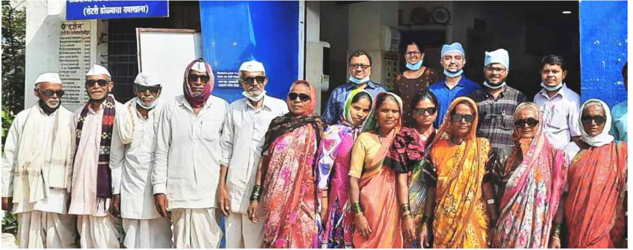
RC சங்கம்னெரின் ரோட்டரி கண் மருத்துவமனையில் கண் புறை சிகிச்சை செய்யப்பட்டோர்.