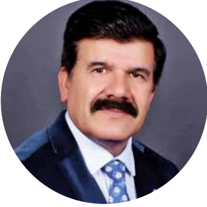
V P கல்தா