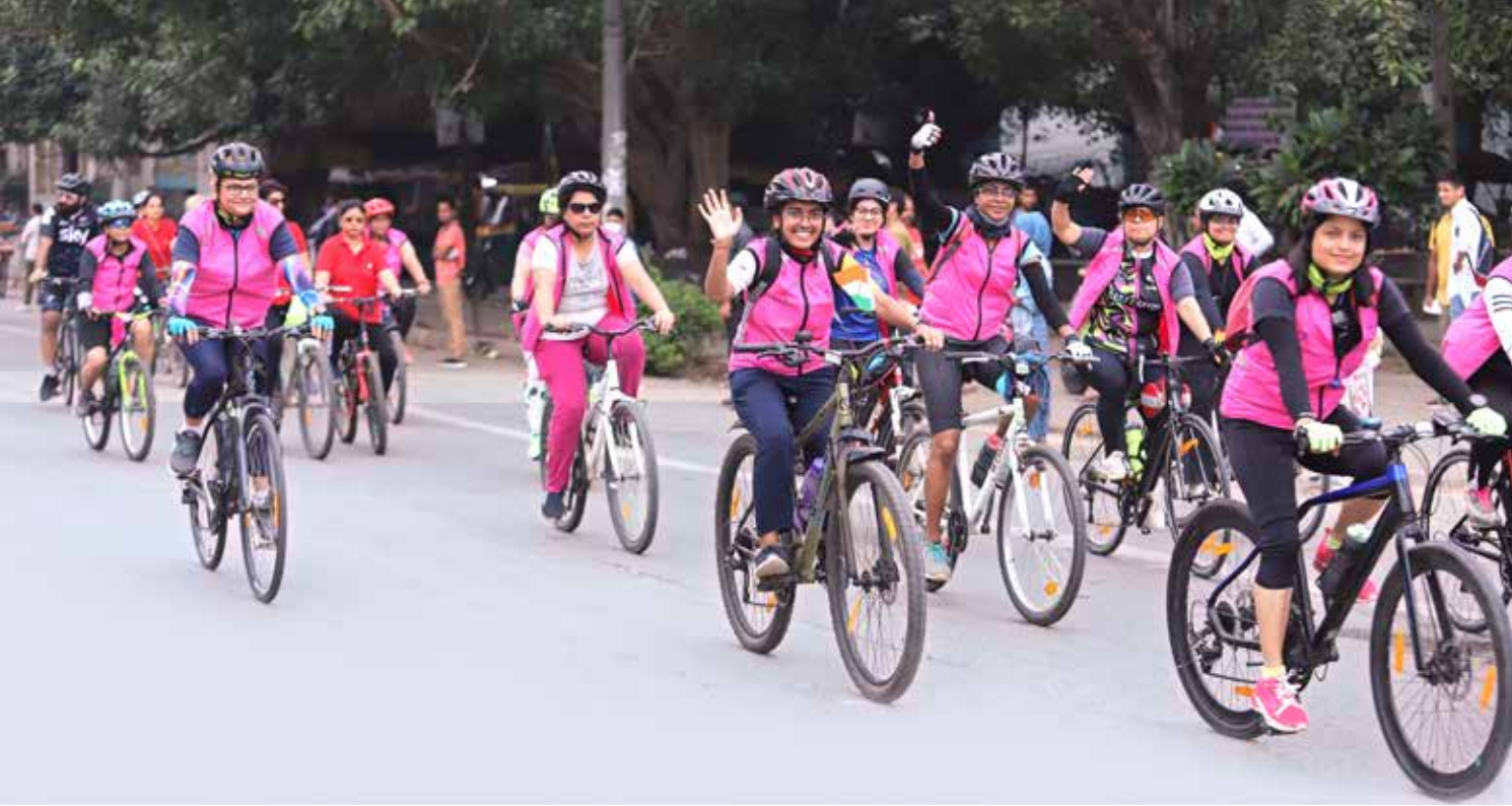
மிதிவண்டி பேரணியில் பங்கு பெறும் பெண்கள்.

ஆதரிக்கிறது. இது எங்களை மேலும் செய்ய ஊக்குவிக்கிறது, அடுத்த ஆண்டுக்கான நிகழ்ச்சியை நாங்கள் ஆவலுடன் எதிர்நோக்குகிறோம்” என்று விளக்கினார்.