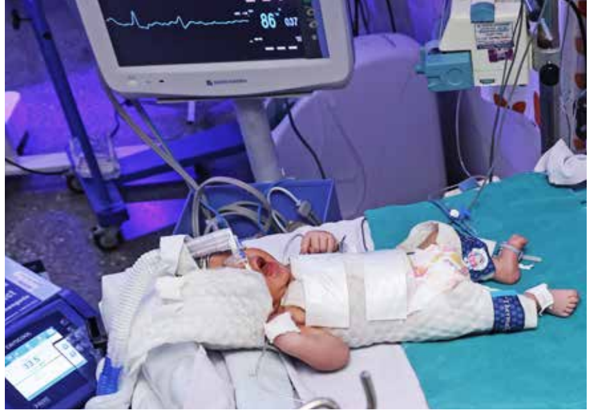
அரசு மருத்துவமனையில் க்ரிட்டிகூல் உபகரணம் மூலம் சிகிச்சை பெறும் ஒரு குழந்தை.

2008-09ம் ஆண்டில், சங்கம் ௯.4 லட்சம் திட்ட மதிப்பீட்டில் அரசு மருத்துவமனையில் பிறந்த குழந்தை வார்டை அமைத்தது. “நாங்கள் இந்த மகப்பேறு வார்டை ஒரு வரையறுக்கப்பட்ட வசதி மற்றும் உபகரணங்களுடன் தொடங்கினோம். ஆனால் பிறந்த குழந்தை பராமரிப்புக் கான தேவை அதிகரித்துள்ள