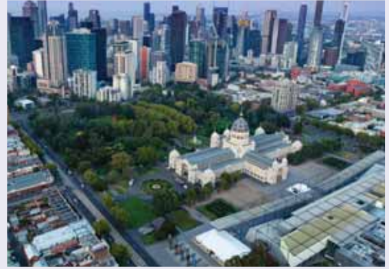
மெல்போர்னில் உள்ள கார்ல்டன் கார்டன்ஸ்.

மெல்போர்ன் ஆஸ்திரேலியாவின் பண்பாட்டுத் தலைநகரம் என அறியப்படுகிறது, அதற்கு ஒரு பெரிய காரணம், அதன் அருங்காட்சியகங்கள். 27 மே முதல் 31 மே வரை நடைபெறும் 2023 RI மாநாட்டின் போது, இந்த நகரில் உள்ள பல்வேறு அருங்காட்சியகங்களில் காட்சிப்படுத்தப்பட்டுள்ள வரலாற்று, கலை, படைப்பூக்கப் பொருட்களைக் கண்டிப்பாகப் பாருங்கள்.