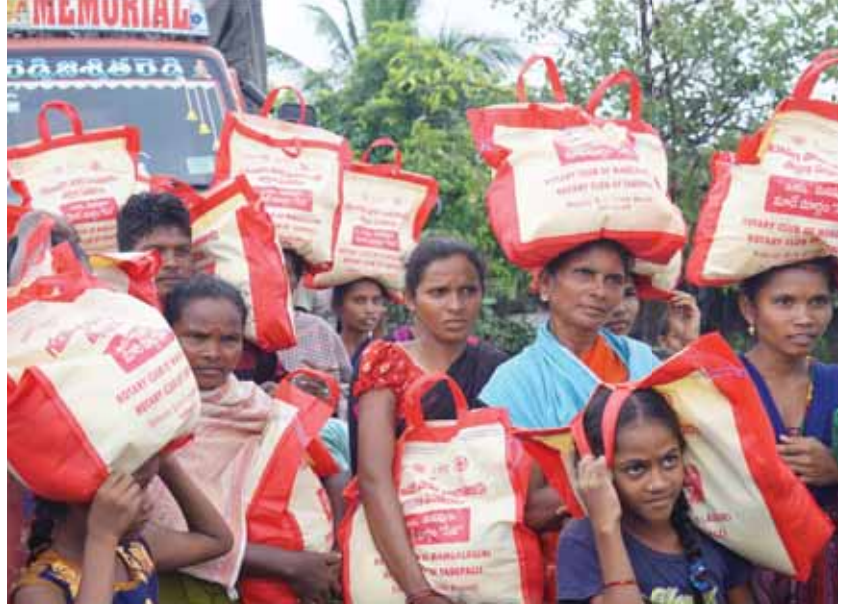
RID 3150 ரொட்டேரியன்கள் அளித்த மளிகை சாமான் பைகளுடன் மக்கள்.