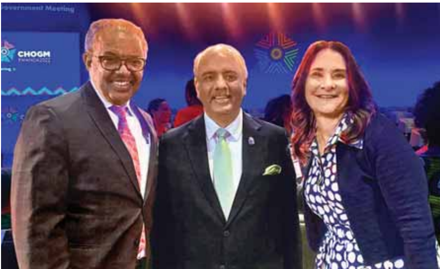
WHO இயக்குனர் ஜெனரல் டெட்ராஸ் அதனாம் கெப்ரியேஸஸ், சில் மற்றும் மெலிண்டா கேட்ஸ் அறக்கட்டளை இணை நிறுவனர் மெலிண்டா கேட்ஸ் அவர்களுடன் RI தலைவர் மேத்தா.

சர்வதேச கருத்தொற்றுமை மற்றும் நல்லெண்ணத்தில் அவர்களின் பங்களிப்பு களுக்காக வழங்கப்பட்டு வருகிறது.