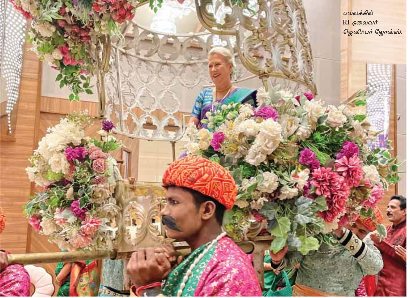
பல்லக்கில் RI தலைவர் ஜெனீஃபர் ஜோன்ஸ்.