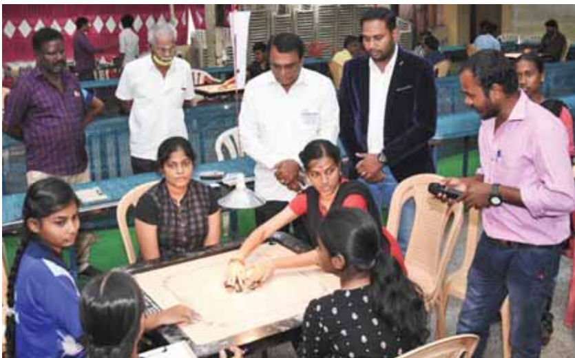
மாநில அளவு கேரம் போட்டி.

கரூரில் சமூக அடிப்படையிலான ஐந்து ரோட்டராக்ட் சங்கங்களும், நிறுவனம் அடிப்படையில் 13 சங்கங்களும் உள்ளன. இவற்றில் 1,500க்கும் மேலானவர்கள் உறுப்பினர்களாக உள்ளனர். ஆனால், அவர்களில் 85 சதவீதம் பேர் இன்னும் மை ரோட்டரி போர்டலில் (வலை முகப்பில்) இன்னும் தங்களை பதிவு செய்து கொள்ளவில்லை. இது கட்டாயத் தேவையாகும். ■