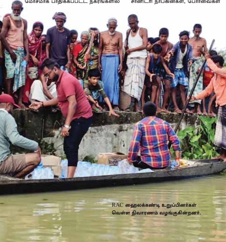
RAC ஹைலக்கண்டி உறுப்பினர்கள் வெள்ள நிவாரணம் வழங்குகின்றனர்.