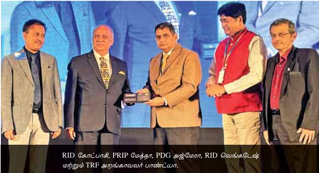
RID கோட்பாதி, PRIP மேத்தா, PDG அஜ்மேரா, RID வெங்கடேஷ் மற்றும் TRF அராங்காலலர் பாண்ட்யா.