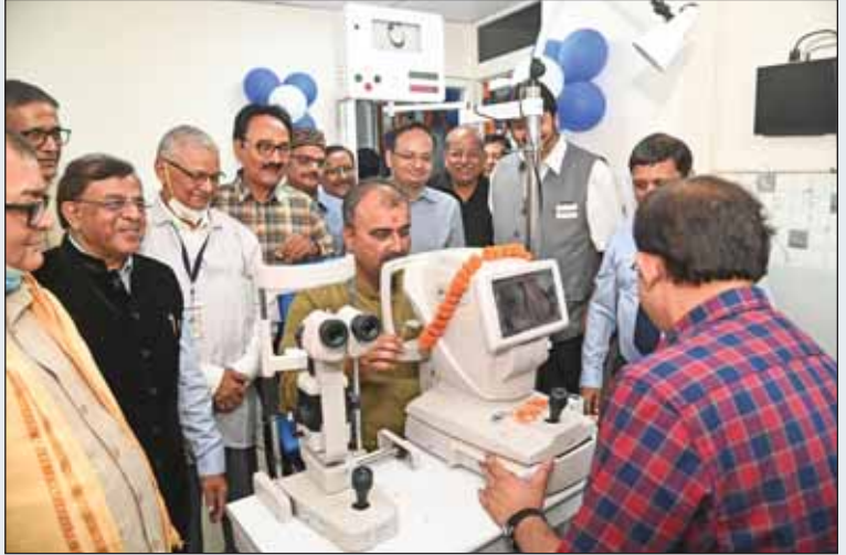
பீகார் சுகாதாரத்துறை அமைச்சர் மங்கள் பாண்டே கண் மருத்துவமனையை துவக்கி வைக்கிறார்.