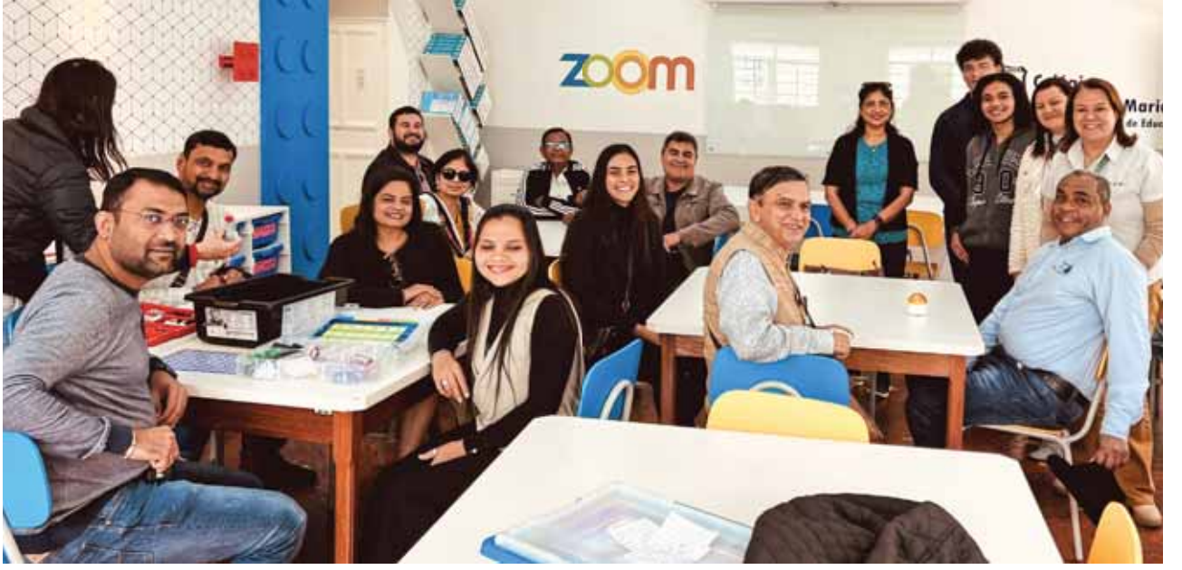
இந்திய ரோட்டேரியன்கள் சீரேசிலில் ஒரு பள்ளிக்கூடத்தில்.