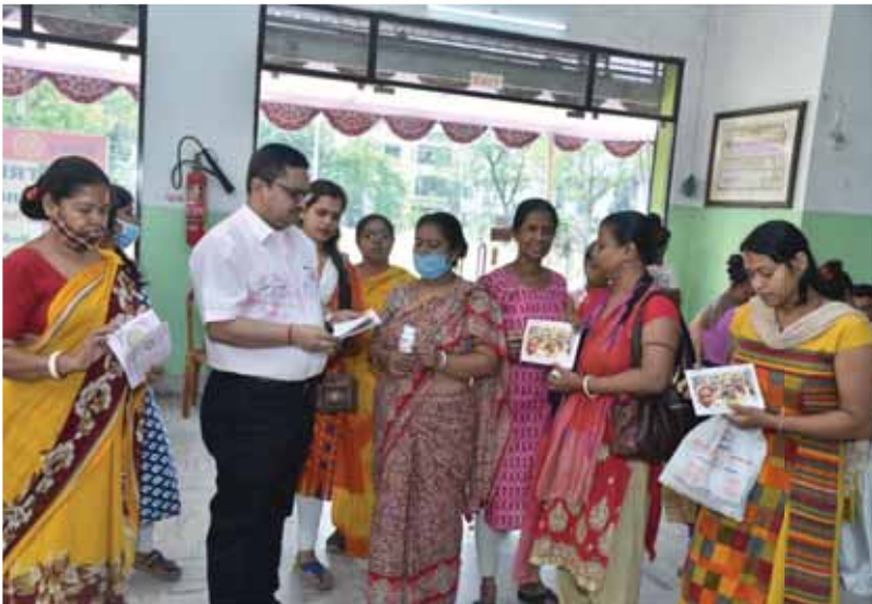
இரத்த சோகை பற்றிய புத்தகங்கள் முகாமில் வழங்கப்படுகிறது.