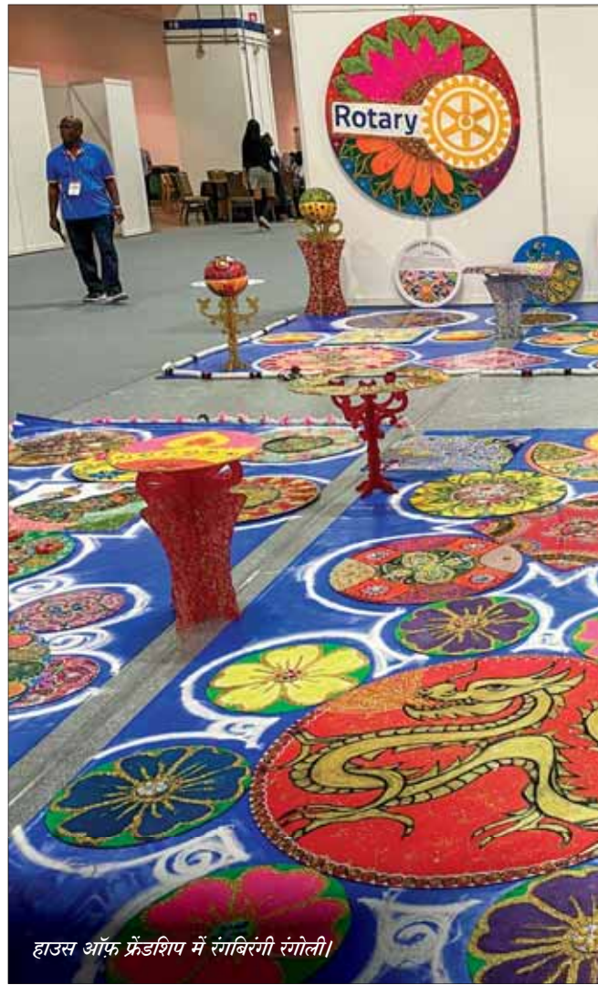
हाउस ऑफ फ्रेंडशिप में रंगबिरंगी रंगोली।