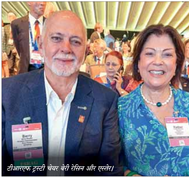
टीआरएफ ट्रस्टी चेरर बेरी रेसिन और एस्तेर।