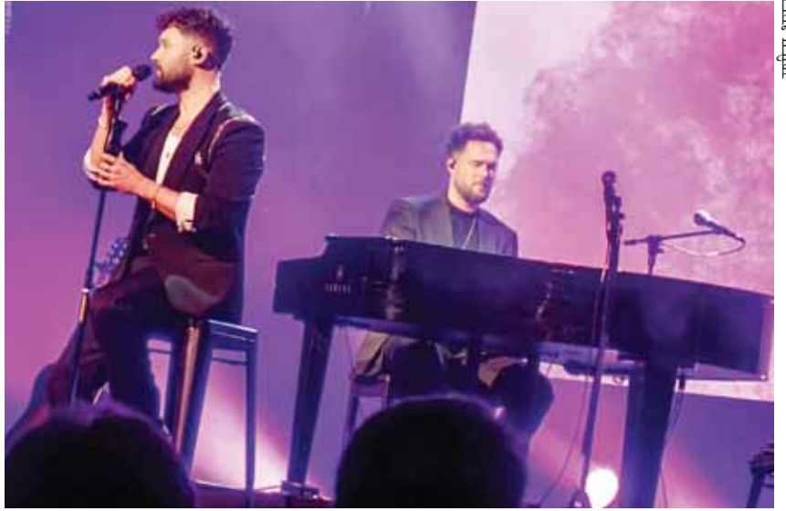
ब्रिटिश पॉप स्टार कैलम स्कॉट सम्मेलन में प्रस्तुति देते हुए।

उद्घाटन सत्र में ब्रिटिश पॉप स्टार टैलम स्कॉट द्वारा कुछ हृदय स्पर्शी गीत गाए गए, वो स्वयं भी अवसाद से जूझ चुके हैं और अपने संघर्ष के बारे