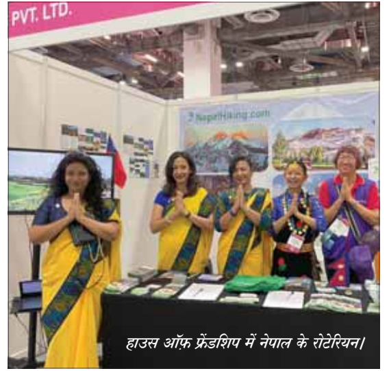
हाउस ऑफ फ्रेंडशिप में नेपाल के रोटेरियन।