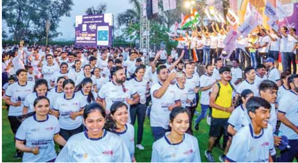
मैराथन में भाग लेने वाले प्रतिभागी।