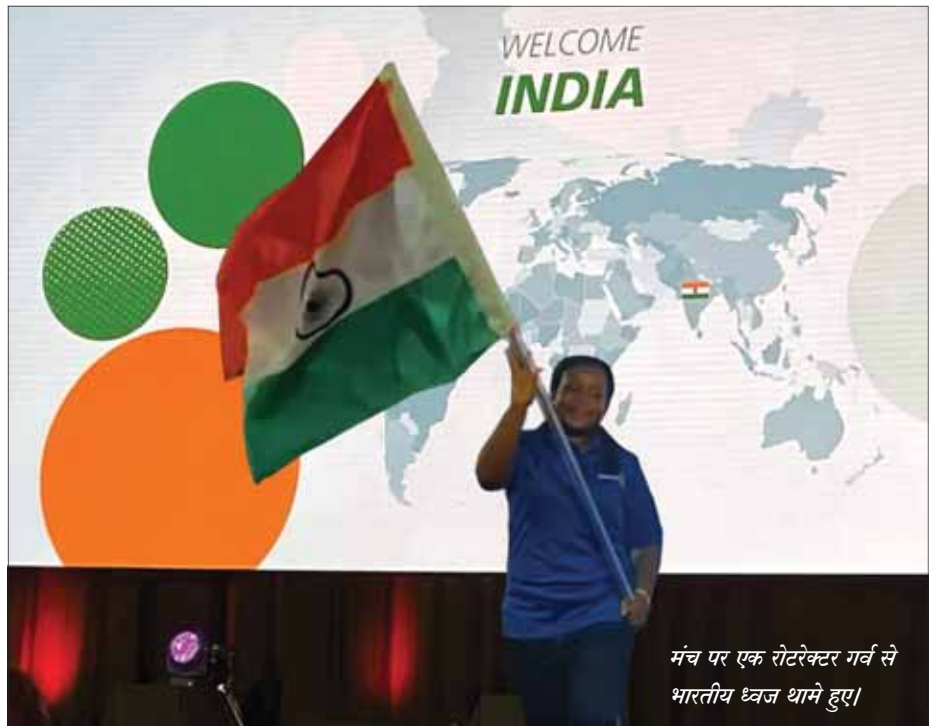
मंच पर एक रोटरेक्टर गर्व से भारतीय ध्वज थामे हुए।