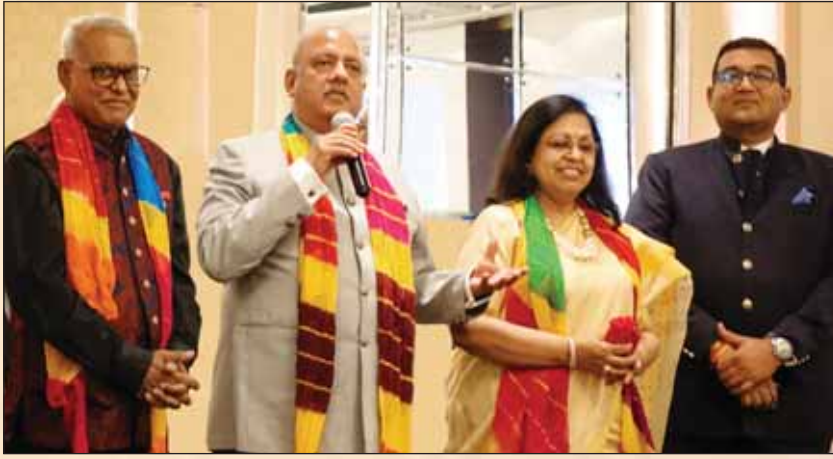
रो ई निदेशक रॉयचौधरी, PRIP मेहता, राशी और पीडीजी भंडारी।