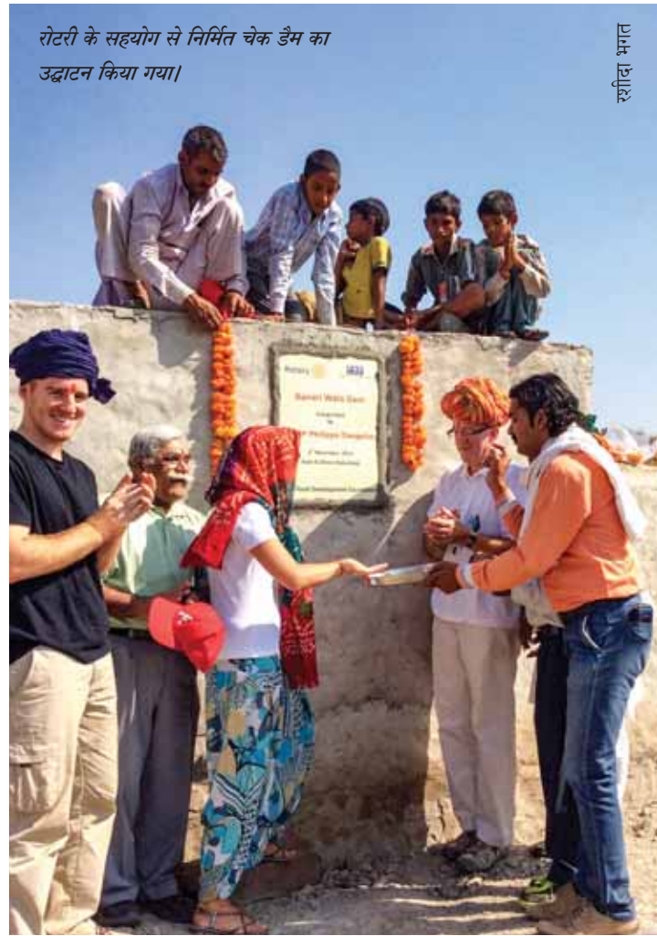
रोटरी के सहयोग से निर्मित चेक डैम का उद्घाटन किया गया।

इसलिए किसानों ने अब आंवला, नींबू, मोसंबी, सेब बेर (भारतीय बेर जिसे चीनी खजूर भी