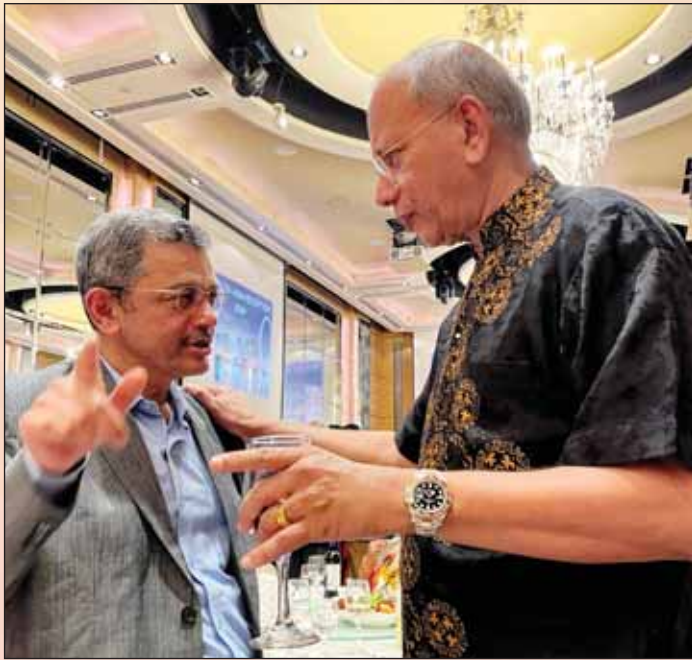
PRIP के आर रविन्द्रन और टीआरएफ के उपाध्यक्ष पांड्या।