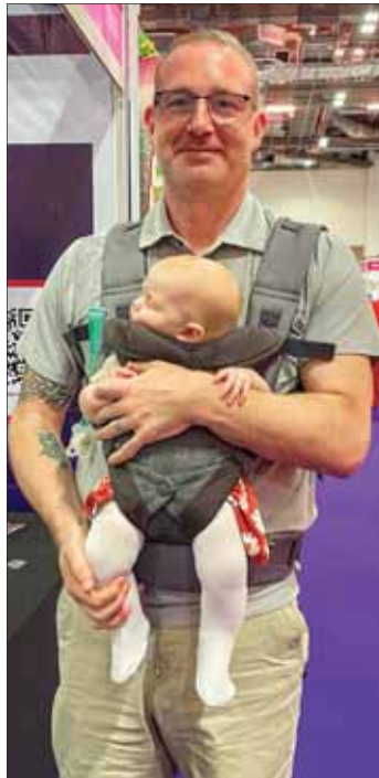
एक रोटेरियन अपने छोटे बच्चे के साथ।

दर्शकों का स्वागत करते हुए, ह्यूको ने कहा कि चूंकि यह वास्तव में वैश्विक दर्शक थे, इसलिए उनकी इच्छा थी कि वे जितनी भाषाएँ बोलते हैं, उससे कहीं अधिक बोल पाते। लेकिन रुकिए... शायद वह ऐसा कर पाएँ, उन्होंने कहा, जब उनकी छवि स्क्रीन पर दिखाई गई, तो उन्होंने हिंदी में कहा: सिंगापुर में आपके साथ होना एक आनंद है छवि ने फ्रेंच, कोरियाई और चीनी में भी यही कहा। अनुमान के मुताबिक, इसके लिए एक AI टूल का इस्तेमाल किया गया था।■