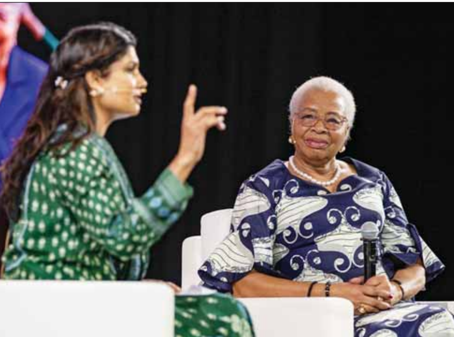
मोजाम्बिक की पूर्व शिक्षा मंत्री और अंतर्राष्ट्रीय महिला एवं बाल अधिकार कार्यकर्ता ग्रासा माचेल (दाएं)।

यह पूछे जाने पर कि विभिन्न क्षेत्रों और विभिन्न परिस्थितियों में लड़कियों एवं महिलाओं द्वारा अनेक असमानताओं का सामना किया जा रहा है साथ ही लड़कियों एवं महिलाओं को अक्सर जलवायु परिवर्तन, हिंसा और संघर्ष से विस्थापन का खामियाजा भुगतना पड़ता है और रोटेरियन महिलाओं के सशक्तिकरण के लिए क्या कर सकते हैं, इस पर वह कहती हैं कि जिम्मेदारी यहाँ महत्वपूर्ण शब्द है। “जिम्मेदारी ले लीजिए; यहाँ बहुत से लोग प्रभावकारी और अधिकारी पदों पर हैं। उस शक्ति का उपयोग करते हुए महिलाओं की भलाई एवं उनके कल्याण के लिए काम करें। महिलाओं को भी समान वेतन दें, उनके अद्वितीय योगदान के प्रति संवेदनशील रहें। शिक्षा, शिक्षा, शिक्षा! लड़कियों को शिक्षित करें!” ■