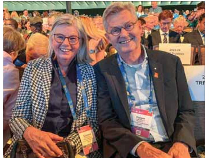
PRIP नेक और सुजेन।