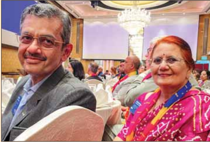
टीआरएफ के उपाध्यक्ष पांड्या और माधवी।