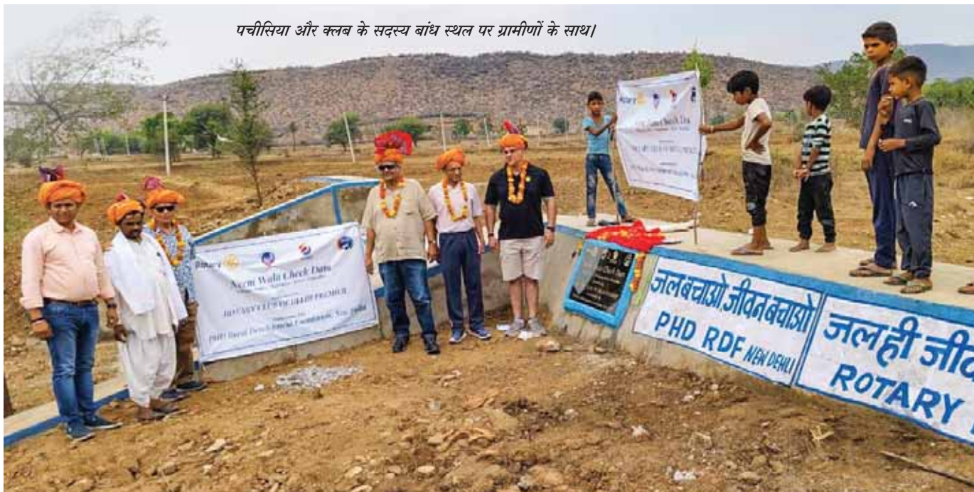
पचीसिया और क्लब के सदस्य बांध स्थल पर ग्रामीणों के साथ।