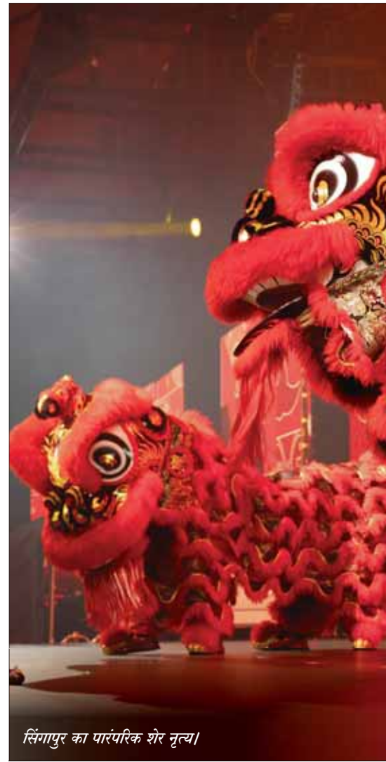
सिंगापुर का पारंपरिक शेर नृत्य।