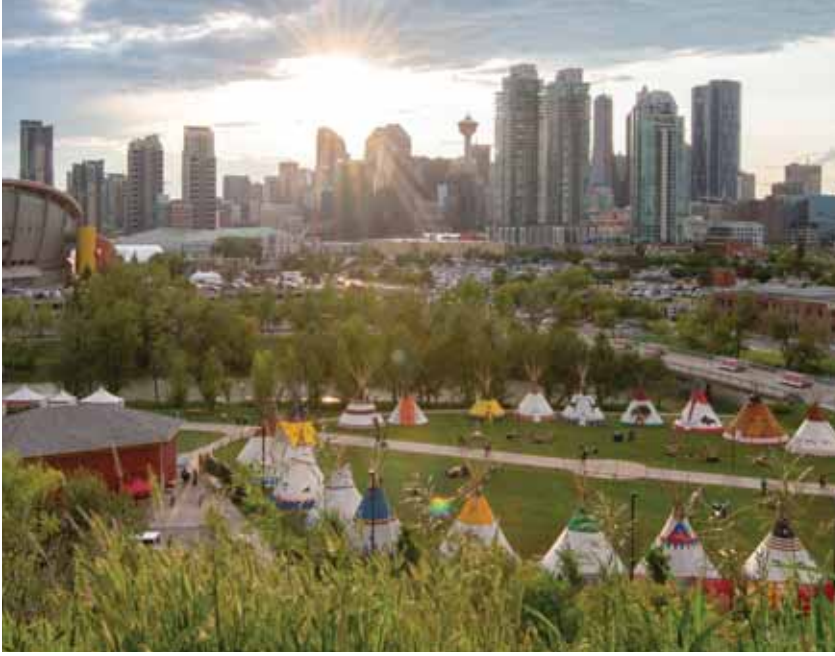
कैलगरी स्टैम्पेड मैदान पर स्थित एल्बो रिवर कैम्प, प्रथम राष्ट्र संस्कृति का जश्न मनाता है।

एक महाकाव्य पृष्ठभूमि वाले सम्मेलन में कनाडा में अपने रोटरी 'बेस्टीज' से मिलने की योजना बनाना शुरू करें: रॉकी माउंटेन तलहटी।