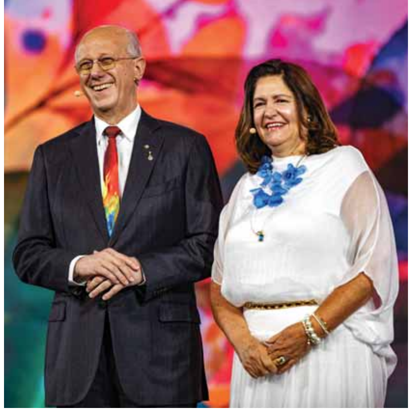
மனைவி டெனிஸூடன் RIPN டி கமர்கோ.

உறுப்பினர் எண்ணிக்கையை அதிகரிக்கவும் வருவாயை பெருக்கவும் நாம் தொழில் முனைவோர், வர்த்தகர்கள், மருத்துவர்கள், தொழிலதிபர்கள், வழக்கறிஞர்கள், விற்பனையாளர்கள் (அவர் ஒரு வழக்கறிஞர் மட்டுமல்ல, விற்பனையாளரும் கூட) ஆகியோருடன் தொடர்புகொள்வது முக்கியமானது. “ரோட்டரி பற்றி மக்களிடம் இருக்கும் நன்மதிப்பை நாம் புதுப்பிக்க வேண்டும். புதிய நடைமுறைகளைப் பின்பற்ற வேண்டும். ரோட்டரியின் திட்டத்தை வெற்றிகரமாகச் செயல்படுத்த உத்தரவாதம் அளிக்குமாறு இளம் தலைமுறையினருக்கு வேண்டுகோள் விடுக்க வேண்டும். அதாவது நாம் எடுக்கும் முடிவுகளில் அவர்களுக்கும் பங்கு இருக்கவேண்டும். அவர்களை எடுபிடிகளாக பயன்படுத்தாமல்