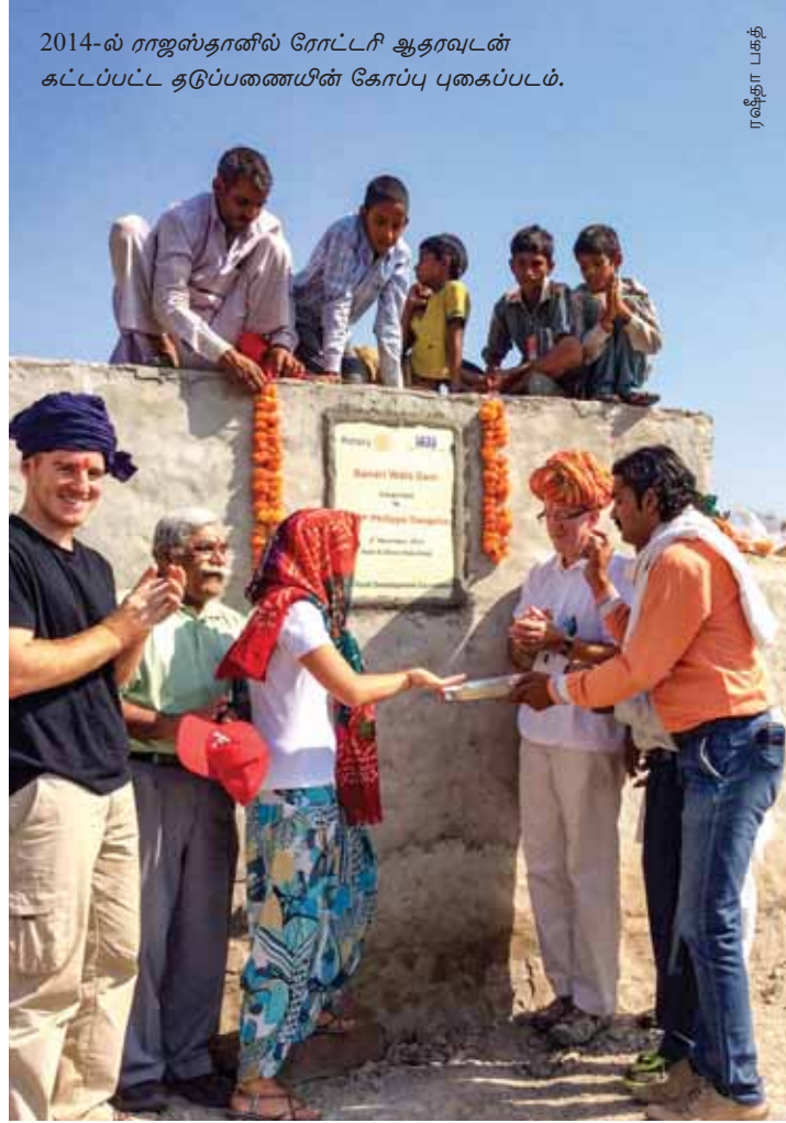
2014-ல் ராஜஸ்தானில் ரோட்டரி ஆதரவுடன் கட்டப்பட்ட தடுப்பணையின் கோப்பு புகைப்படம்.