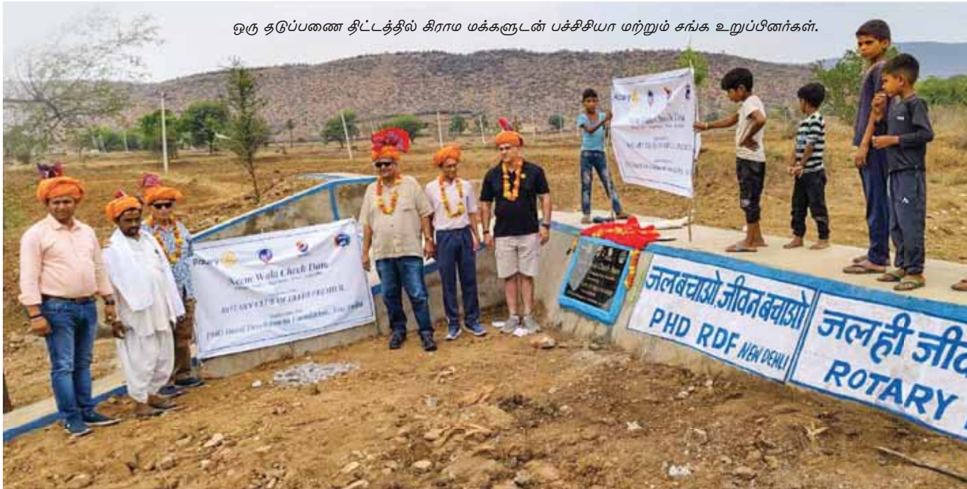
ஒரு தடுப்பணை திட்டத்தில் கிராம மக்களுடன் பச்சிசியா மற்றும் சங்க உறுப்பினர்கள்.