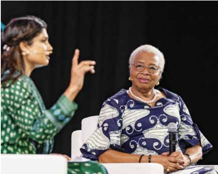
மொசாம்பிக் முன்னாள் கல்வி அமைச்சர் மற்றும் சர்வதேச பெண்கள் மற்றும் குழந்தைகள் உரிமை ஆர்வலர் கிரேசா மச்சேல் (வலது).

பல்வேறு பிராந்தியங்களில், பல்வேறு சூழல்களில் சிறுமிகளும், பெண்களும், அநீதி, வன்முறை, மோதல் உள்ளிட்ட பிரச்னைகளை சந்திக்க வேண்டியுள்ளது. மேலும் பருவநிலை மாற்றத்தால் இடப் பெயர்ச்சியையும் சந்திக்க வேண்டியுள்ளது என்றார். பெண்களின் மேம்பாட்டுக்கு ரோட்டரி எந்தவிதத்தில் உதவ முடியும் என்று கேட்டபோது, “பொறுப்புணர்வுதான் இங்கு முக்கியமானது. பொறுப்பை ஏற்றுக்கொள்ள இங்கு பலர் செல்வாக்கு மற்றும் அதிகாரத்தில் இருக்கின்றனர். நமக்குள்ள அதிகாரத்தை நல்ல விஷயங்களுக்கு குறிப்பாக பெண்களின் நல்வாழ்வுக்கு நாம் பயன்படுத்திக் கொள்ளவேண்டும். பெண்களுக்கு ஒரே மாதிரியான ஊதியம் வழங்கப்பட வேண்டும். அவர்களின் தனித்துவமான பங்களிப்பை உணர்ந்துகொள்ள வேண்டும். எல்லாவற்றுக்கும் மேலாக “பெண் கல்வி” முக்கியமானது என்றார். ■