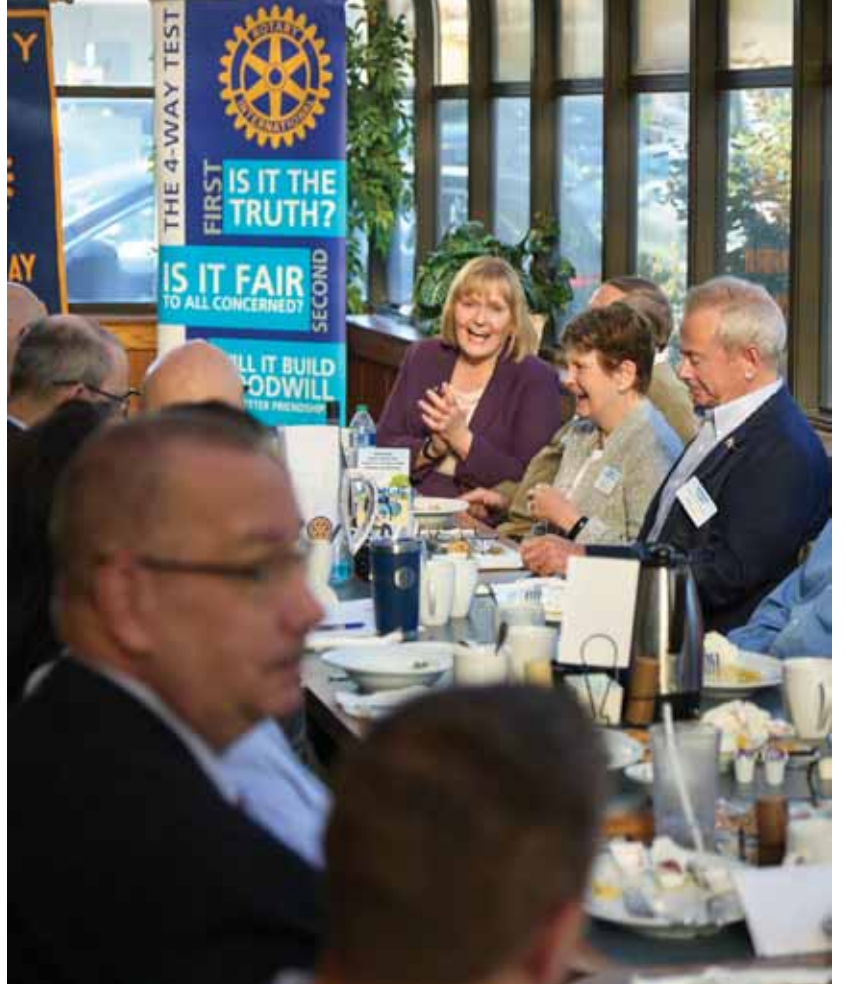
தனது சங்க உறுப்பினர்களுடன்.

குழந்தை பருவத்தில் ஸ்டெஃப்னி, நான்ஸி ட்ரூவின் மர்ம