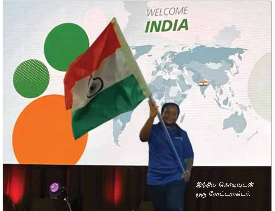
இந்திய கொடியுடன் ஒரு ரோட்டராக்டர்.