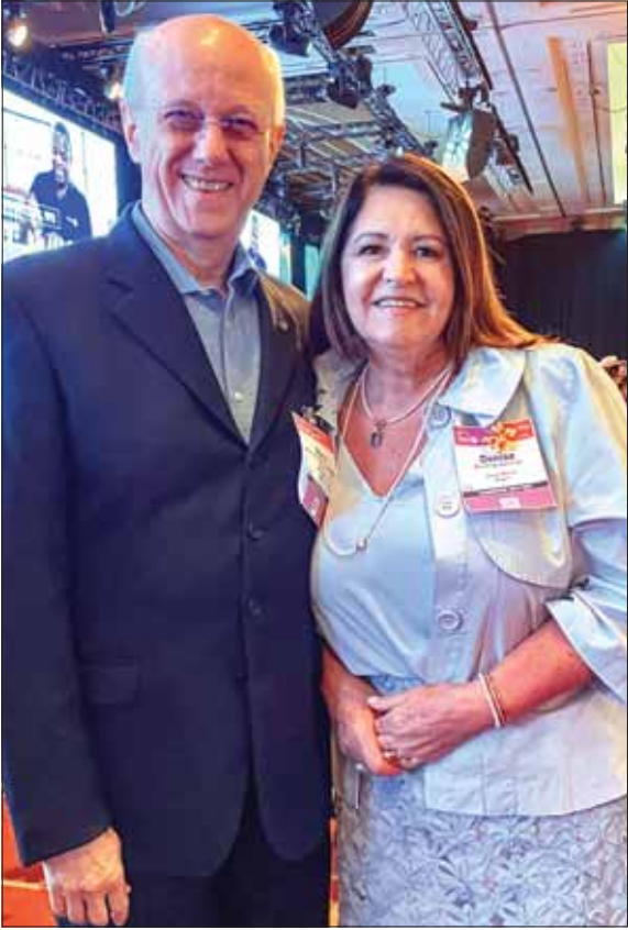
RIPN டி கமர்கோ மற்றும் டெனிஸ்.