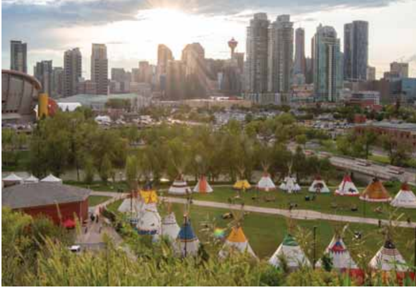
எல்போ ரிவர் கேம்ப், கால்கரி

தயாராகுங்கள், கனடாவில் பாறைகள் நிறைந்த மலையடிவாரத்தின் அழகிய பின்னணியில் நடைபெறவிருக்கும் மாநாட்டில் உங்களுடைய ரோட்டரி நண்பர்களைச் சந்திக்கத் திட்டமிடுங்கள்!