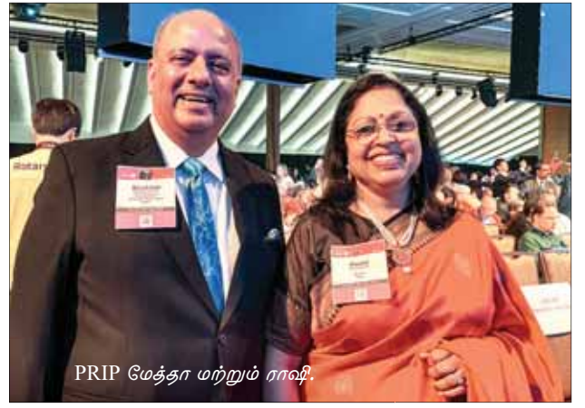
PRIP மேத்தா மற்றும் ராவி.