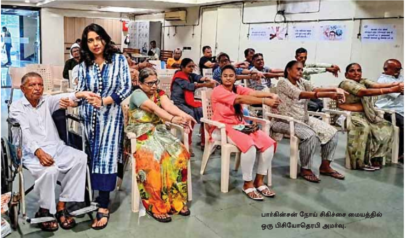
பார்கின்சன் நோய் சிகிச்சை மையத்தில் ஒரு பிசியோதெரபி அமர்வு.