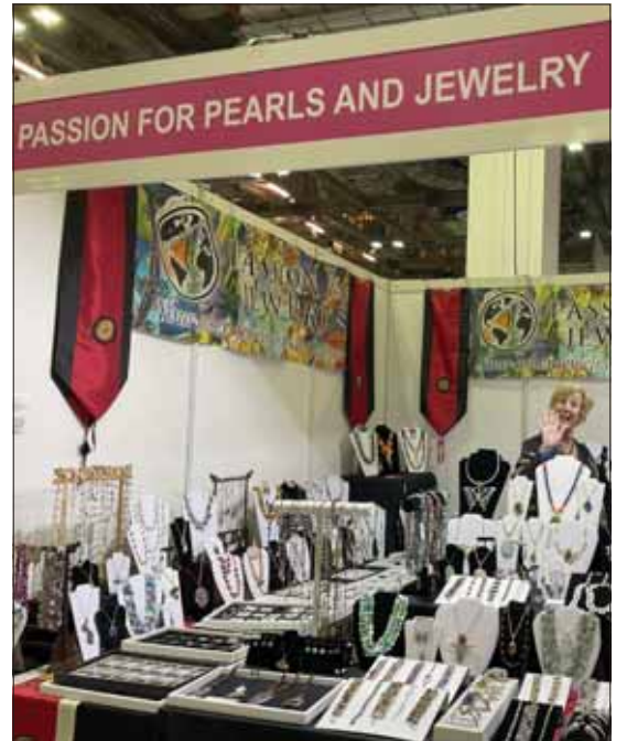
ஹவுஸ் ஆஃப் ஃப்ரெண்ட்ஷிப்-ல் ஒரு நகைக்கடை.