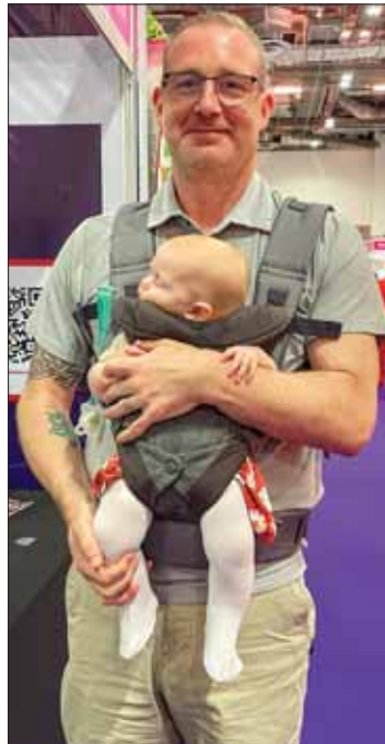
ஒரு ரோட்டேரியன் தன் குழந்தையுடன்.