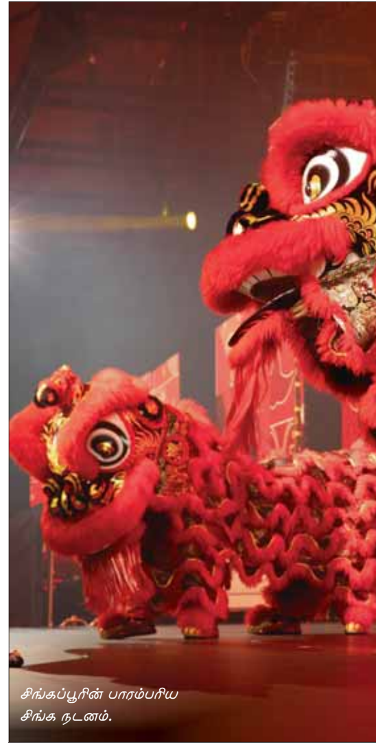
சிங்கப்பூரின் பாரம்பரிய சிங்க நடனம்.