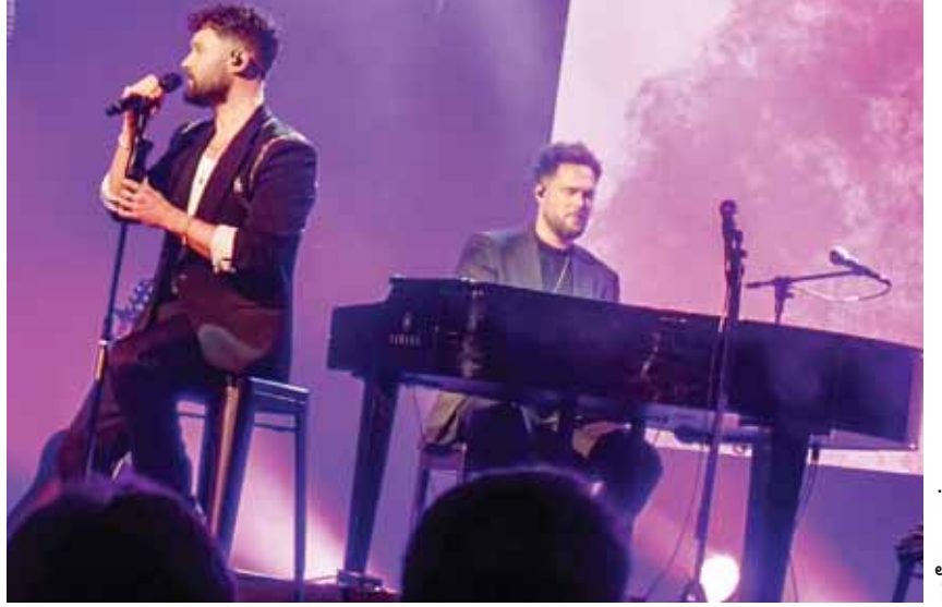
மாநாட்டில் பிரிட்டிஷ் இசைக்கலைஞர் கலம் ஸ்காட்.

சமத்துவமின்மையை எதிர்த்துப் போராடவும், பெண்கள் மற்றும் குழந்தைகளின் உரிமைகளுக்காக போராடவும் பொதுவாழ்வில் தம்மை அர்ப்பணித்துக் கொண்ட கிராசா மசேலின் பேச்சை கேட்கும் வாய்ப்பும் மாநாட்டுப் பிரதிநிதிகளுக்கு கிடைத்தது. அவர் மொசாம்பிக் நாட்டின் கல்வி அமைச்சராகவும், கேப்டவுன் பல்கலைக் கழகத்தின் வேந்தராகவும் பணியாற்றியவர். ஐ.நா.வுடன் இணைந்து பணியாற்றி வருகிறார். குழந்தைகள், இளைஞர்கள் மற்றும் பெண்களின் உடல்