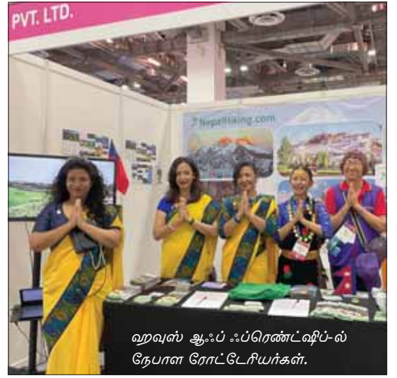
ஹவுஸ் ஆஃப் ஃப்ரெண்ட்ஷிப்-ல் நேபாள ரோட்டேரியர்கள்.