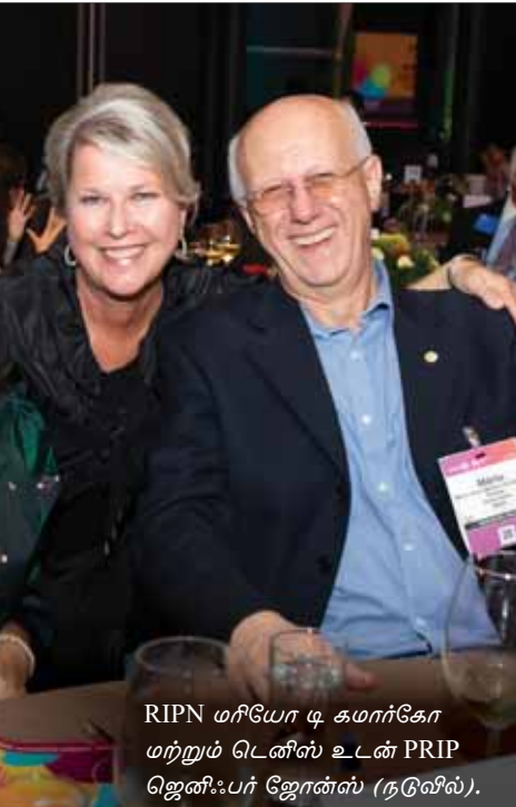
RIPN மரியோ டி கமர்கோ மற்றும் டெனிஸ் உடன் PRIP ஜெனிஃபர் ஜோன்ஸ் (நடுவில்).