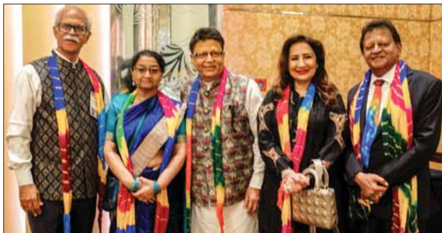
வடிவமைப்பு: S கிருஷ்ணரத்ன